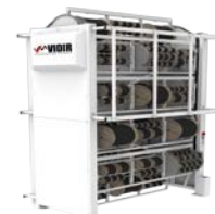
Автоматические системы складирования и хранения