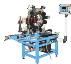
Производство моточных изделий