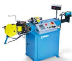
Гибка, формовка и обжим