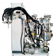
Компаундирование, пропитка и заливка