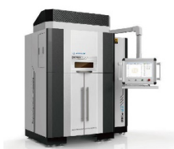
3D печать и сканирование