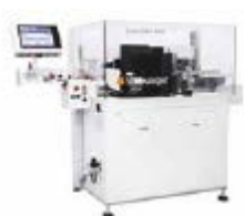
Производство кабельных сборок и жгутов