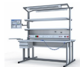
Смарт рабочие места