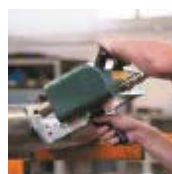
Системы маркирования и прослеживаемости